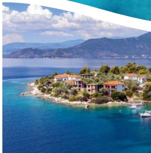
LÉTO U MOŘE